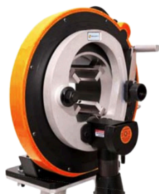
OTSM-2220 1500W voliteľné