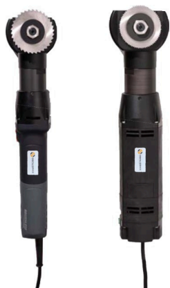
OTSM-1220 1300W štandard

Orbitálne rezačky rúr OTS sa dodávajú v drevenej prepravke so spodným uchytením na prepravu a skladovanie. Štandardný motor píly OTSM-1220 (1300 W) s reguláciou otáčok sa dodáva v samostatnom plastovom kufríku, ktorý sa zmestí do debny spolu so zariadením. Súčasťou dodávky je sada kľúčov a manuál.