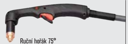
Ruční hořák 75°

(více volitelných možností hořáku viz www.hypertherm.com )