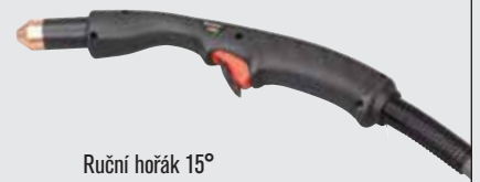
Ruční hořák 15°