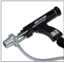
Standardschweißpistole PH-3N PH-3N standard welding gun