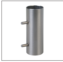
Anwendungsbeispiel Maschinenbau Example of use Machine construction