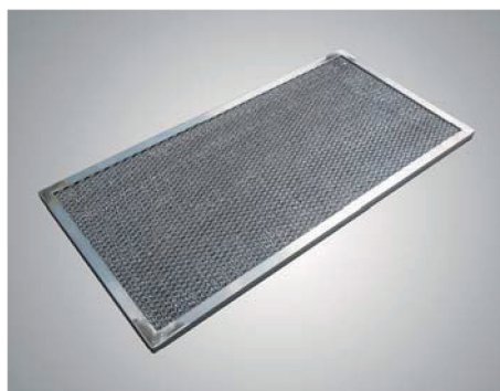
Sieťový hliníkový filter 610 x 305 x 15 mm