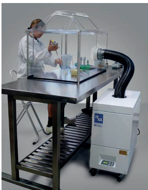
Príklad použitia LMD 504

Zásuvka SUB-D9 umožňuje pripojenie externých zariadení a dostať zo zariadenia ďalšie výstupné signály ako: filter plný, alarm, externý štart/stop, zvýšenie/zníženie odsávacieho výkonu . Zariadenie je dodávané s 5 m napájacím káblom a je okamžite pripravené na použitie. Zvukotesná konštrukcia efektívne redukuje hladinu hluku.