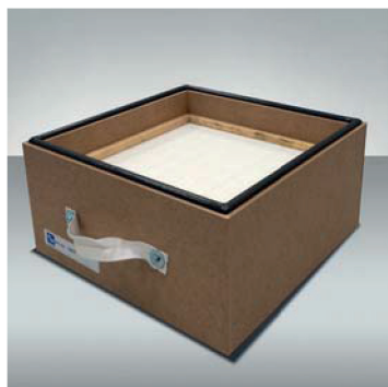
HEPA filter H13