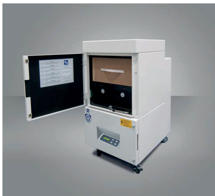
LMD 508 s otvorenými dverami pre prístup ku kazetovým filtrom