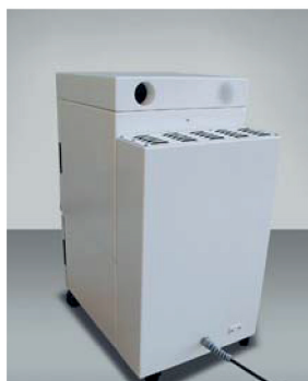
Zadná strana jednotky LMD